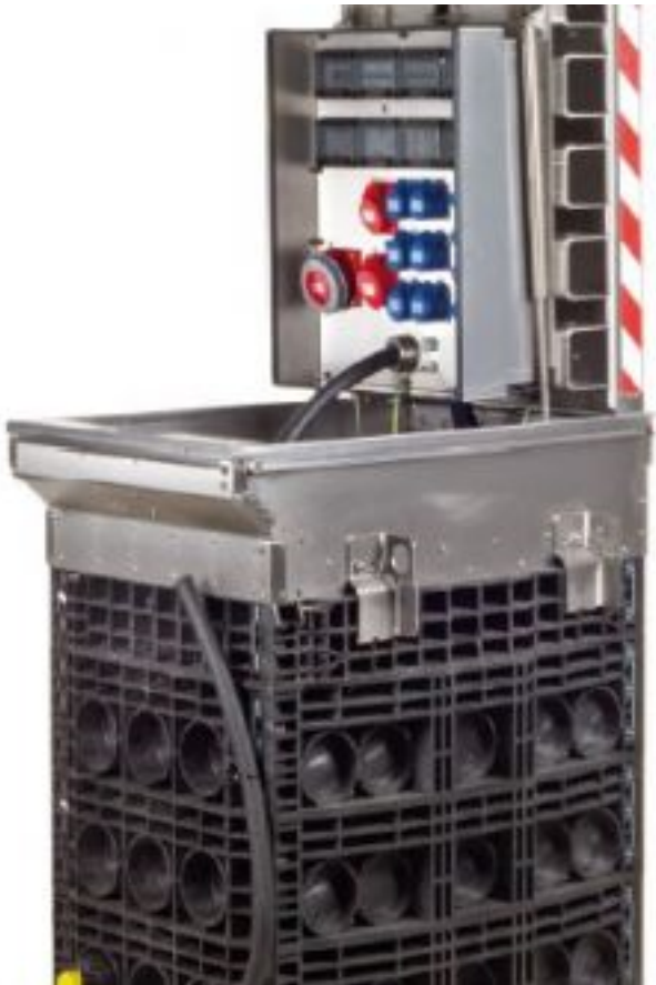
Podzemní zásuvková skříň (šachta)

POZN. - vodotěsná šachta pro osazení ve volném terénu - betonový poklop 600×600 mm, uzamíkatelný - zatížitelnost poklopu D400 (7,5 t) - rozměr šachty 800×800 mm hl. 845 mm